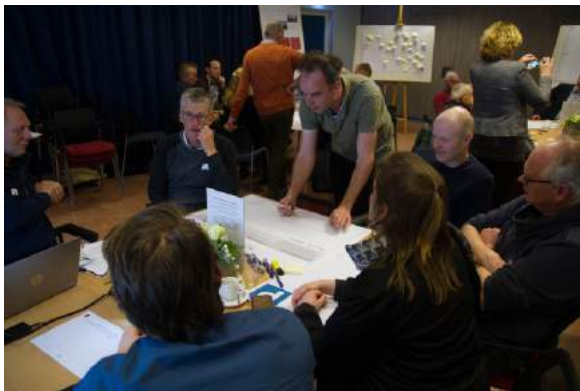
Tijdens de Omgevingsdialoog werden kwaliteiten en grote opgaven voor de toekomst besproken

Lees meer over de resultaten van de Omgevingsdialogen